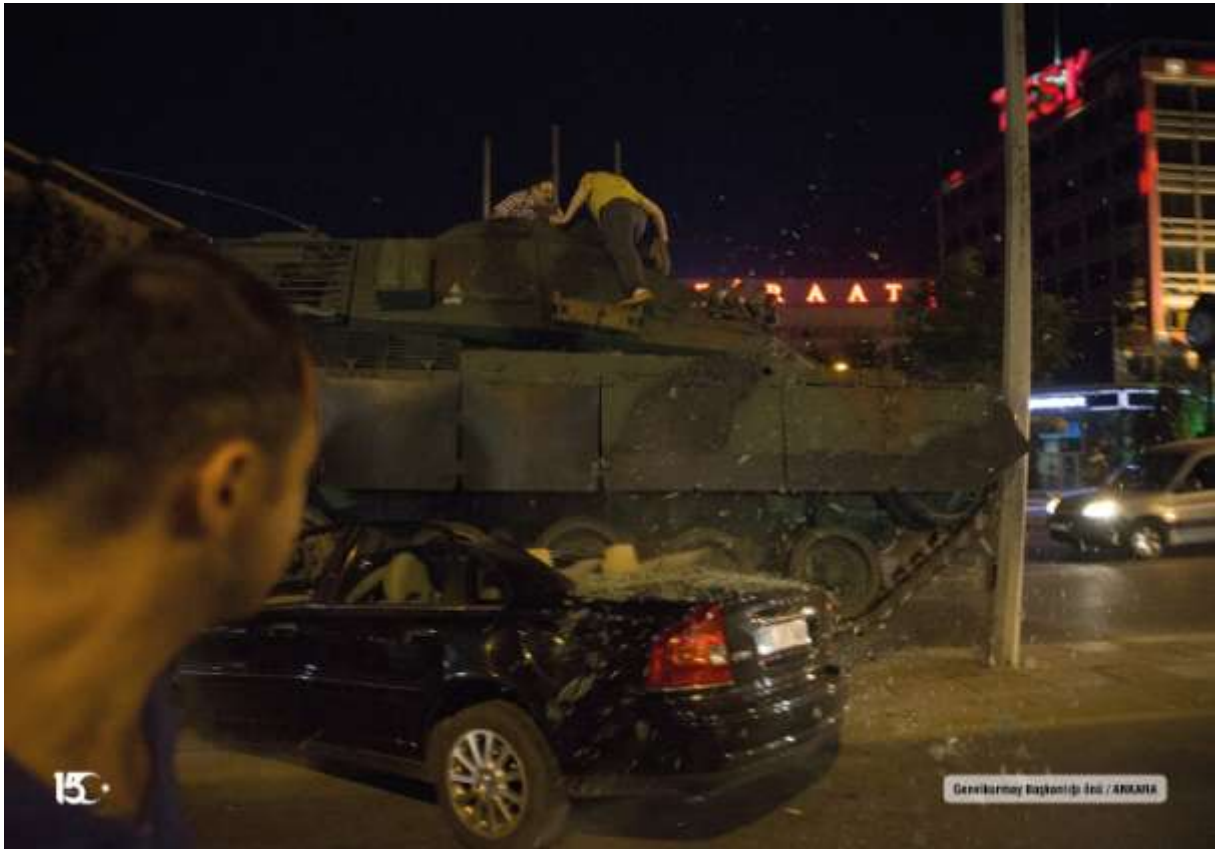
Gevikirmeyi Başkentimiz İstedi / ANKARA