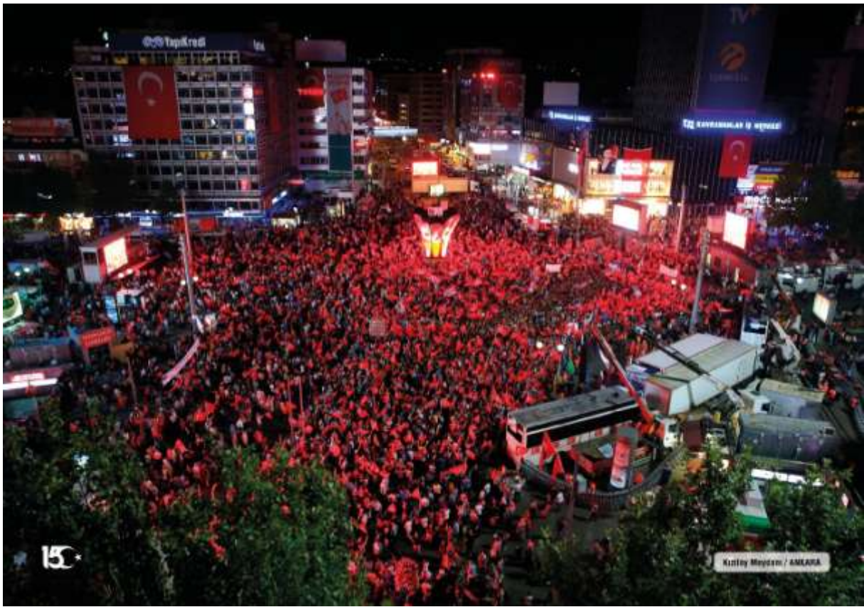
Kızılay Meydanı / ANKARA